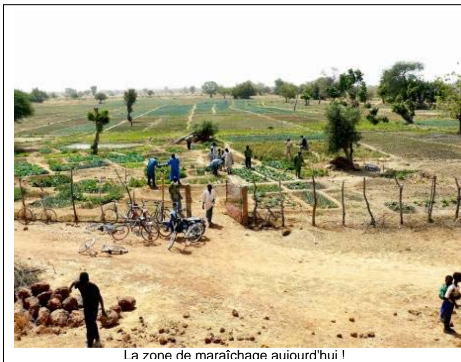
La zone de maraîchage aujourd'hui !

chantier qui est à l'étude actuellement : la construction d'un château d'eau qui permettra d'irriguer des terres arides dans une zone où nous devrions pouvoir multiplier par 10 des cultures maraîchères existantes, actuellement limitées à une très faible superficie, faute d'eau en quantité suffisante. (voir plus bas notre projet prioritaire 2010-2011)