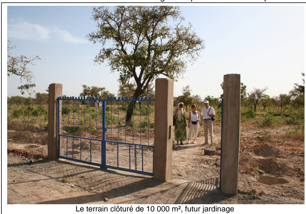
Le terrain clôturé de 10 000 m 2 , futur jardinage

Dans le futur nous voulons faire un centre agro-pastoral en y incluant la formation à l'emploi, des activités à la portée des pauvres. C'est une occasion pour nous de contribuer à l'auto-prise en charge des populations, au bien-être des familles, à la promotion de l'emploi, au développement durable et à la lutte contre la pauvreté sous toutes ses formes.